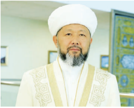
Наурызбай қажы ТАҒАНҰЛЫ, ҚМДБ Төрағасы, Бас мүфти

Аса қамқор, ерекше мейірімді Алланың атымен бастаймын! Барлық мақтау Аллаға тән! Оның Пайғамбары Мұхаммедке салауаттар мен сәлемдер болсын!